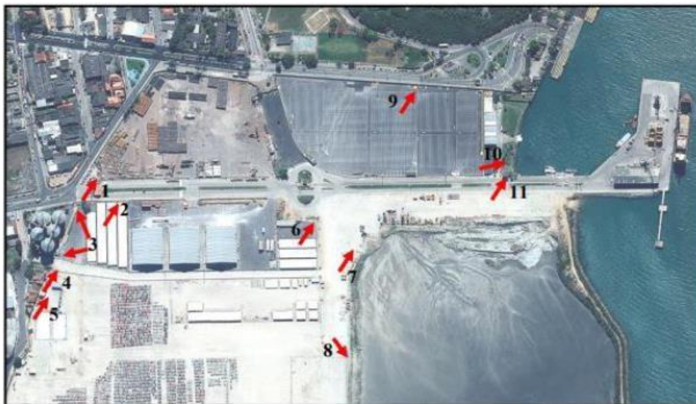
Tabela 4.3-2: Características das caixas